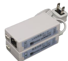
NPL-2001/2002 と NPL-3001 の連結