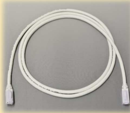
-全14色対応 (標準色 : 白) -