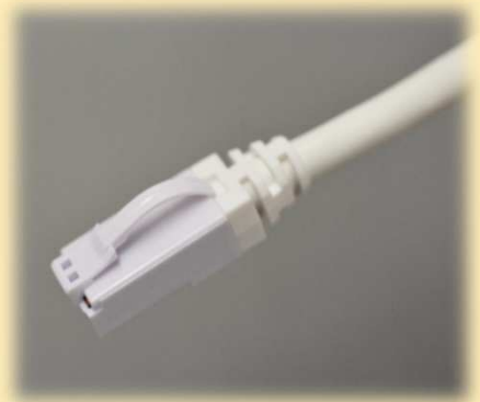
-RJ45プラグもブーツも抗菌-